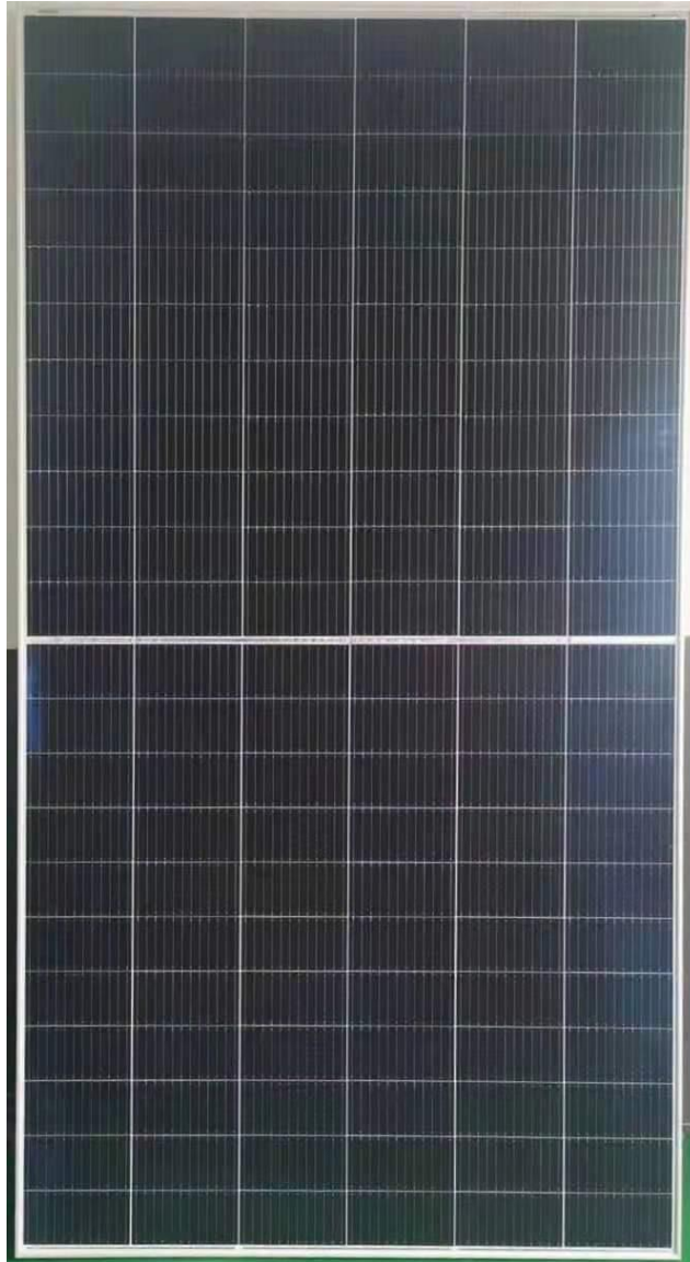
Photo 1: Front view of module type SF665BF-132M12 Foto 1: Vista frontal do tipo de módulo SF665BF-132M12

Annex 1 Photos of modules Anexo 1 Fotos dos módulos