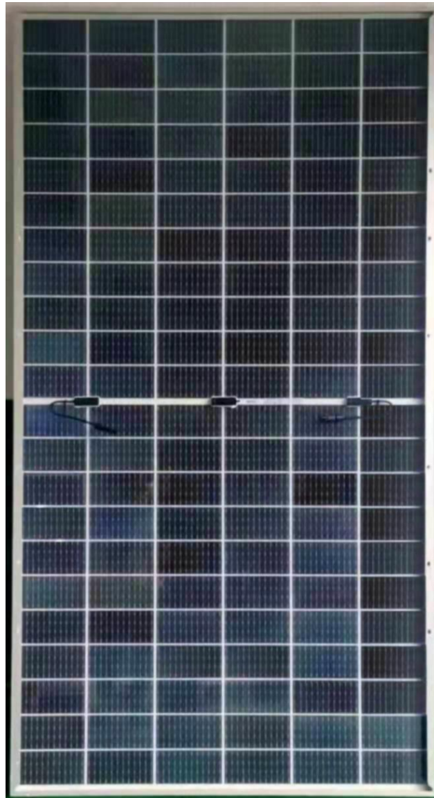
Photo 2: Rear view of module type SF665BF-132M12 Foto 2: Vista da parte traseira do tipo de módulo SF665BF-132M12