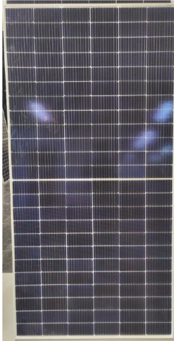
Photo 1: Front view of module type SF-M18/144550 Foto 1: Vista frontal do tipo de módulo SF-M18/144550