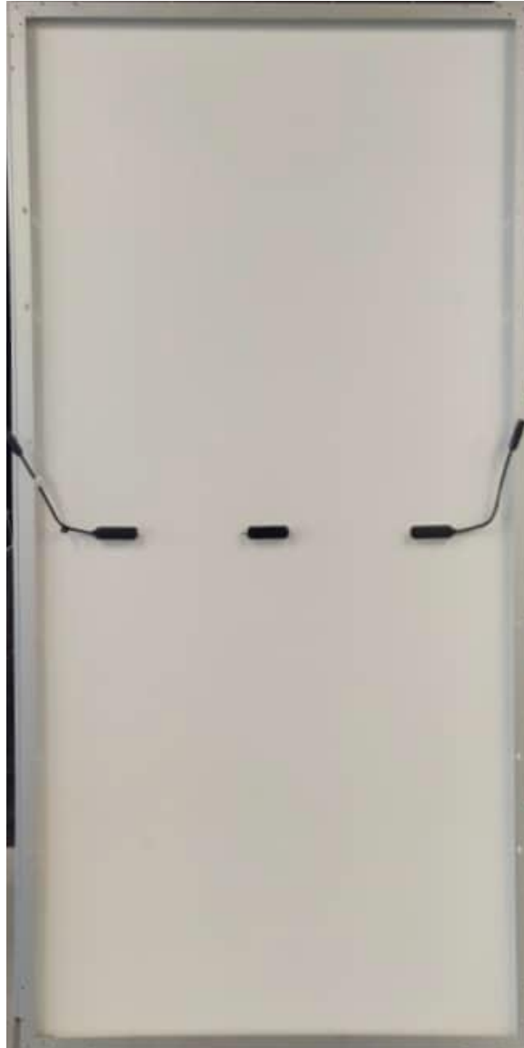
Photo 2: Rear view of module type SF-M18/144550 Foto 2: Vista da parte traseira do tipo de módulo SF-M18/144550